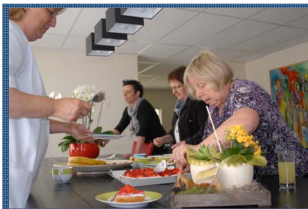
Feestelijke opening in mei 2012