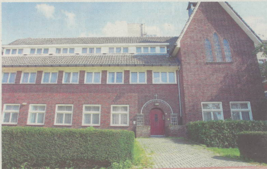
Het klooster dat nu wordt verbouwd.

Plattegrond van de begane grond: 001 hal/entree, 002 kantoor, 003 / 004 onbestemd, 005,007,008 centrale gangen, 009 trap, 006 lift, 010-014 gastenkamers, 015 keuken, 020,022 woonkamer, 018,019 badkamer, 021 wasruimte en 016 gang naar tuin.